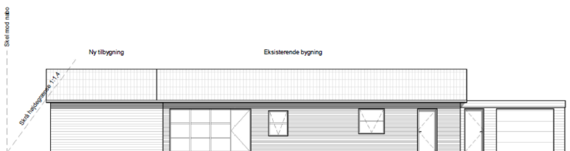
Illustration af facaden mod syd