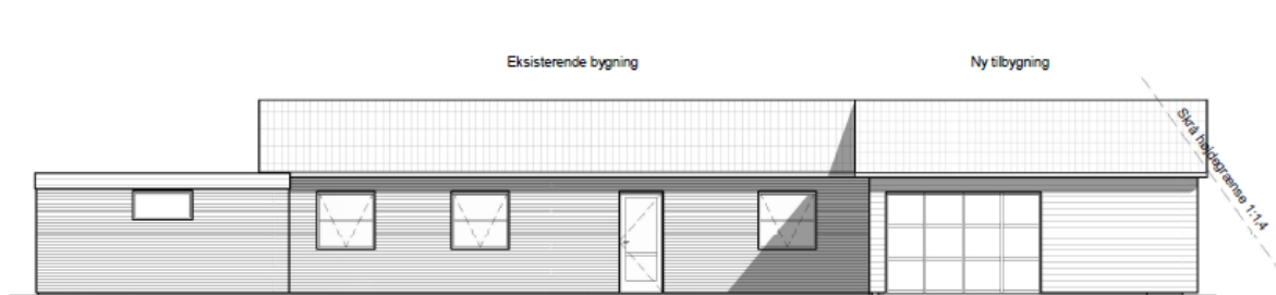
Illustration af facaden mod nord.